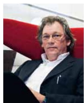
Boven en rechterpagina: Het hoofdgebouw van de Openbare Bibliotheek van Amsterdam op het Oosterdokseiland. Onder: Architect Jo Coenen.